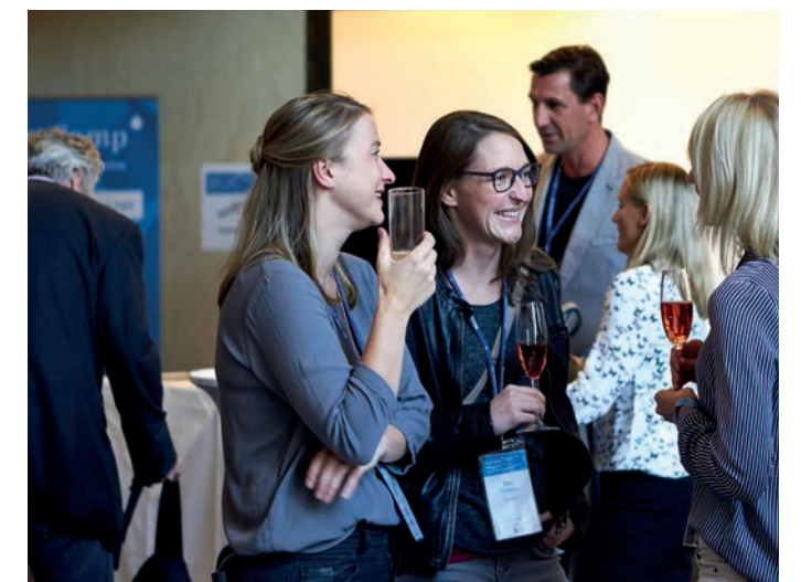
Austausch auf Augenhöhe